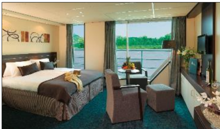
Suite Deluxe pont panorama