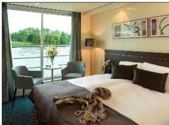
Cabine Double pont supérieur

Desservies par un ascenseur, les cabines réparties sur 3 ponts sont toutes extérieures. Elles disposent d'un ameublement moderne, très confortable, avec deux lits rapprochables, et offrent une décoration raffinée aux tons chaleureux. Les cabines doubles ont une superficie de 15 m 2 et les cabines Suite Deluxe de 22 m 2 . Aux ponts Supérieur et Panorama, les cabines disposent d'une large baie vitrée ouvrable. Au pont Principal, elles disposent d'une petite fenêtre haute (qui ne s'ouvre pas). Toutes les cabines sont équipées d'une salle d'eau avec douche, d'une TV, d'une climatisation, d'un téléphone, d'un sèche-cheveux et d'un coffre-fort. Les cabines Suite Deluxe disposent également d'un coin salon et d'un minibar.