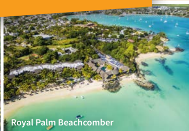
Royal Palm Beachcomber

Vols directs, taxes d'aéroport, transferts privés, 1 excursion privative et 6 nuits d'hôtels.