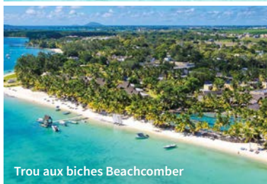
Trou aux biches Beachcomber