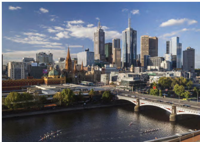
Le Bridge Princess enjambe la rivière Yarra à Melbourne