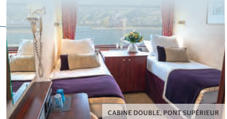
CABINE DOUBLE, PONT SUPÉRIEUR