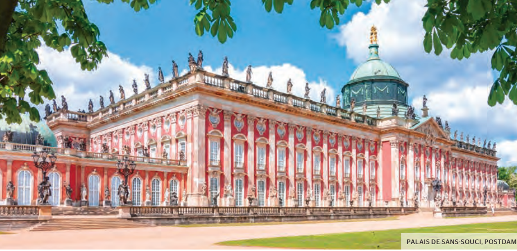
PALAIS DE SANS-SOUCI, POSTDAM